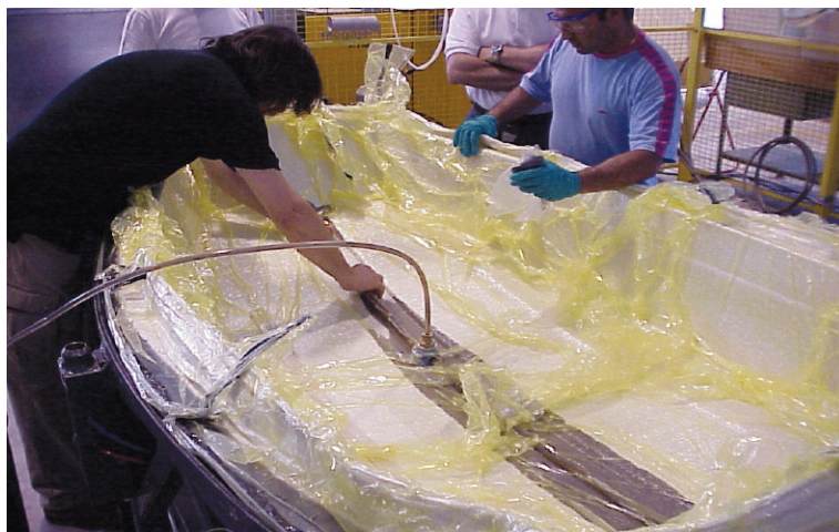
Test di infusione C.S.A. / Infusion test C.S.A.